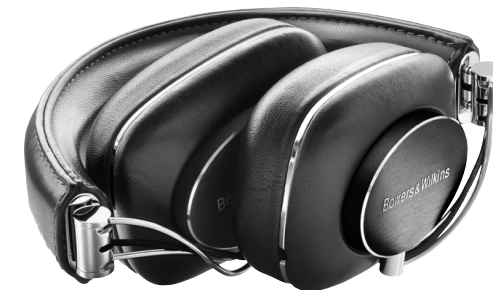
B&W P7 Kopfhörer (405)