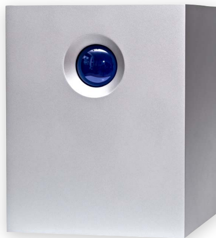
LaCie 5big Thunderbolt RAID (Ausgabe 365)