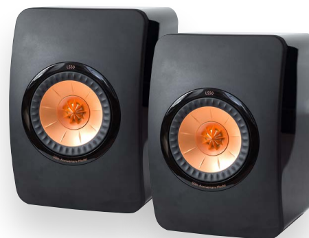
KEF LS50 Passivlautsprecher (369)