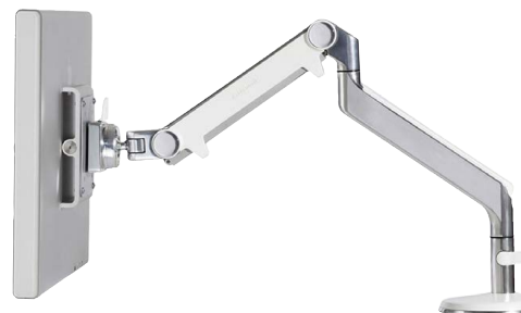
Humanscale M8 Monitorschwenkarm (374)