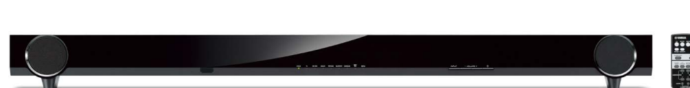
Front Surround-System YAS-152