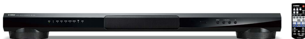
Digital Sound Projector YSP-1400

Als Erfinder der Soundbars verfügt Yamaha über eine einzigartige Expertise. Vor über 10 Jahren präsentierte das Unternehmen mit