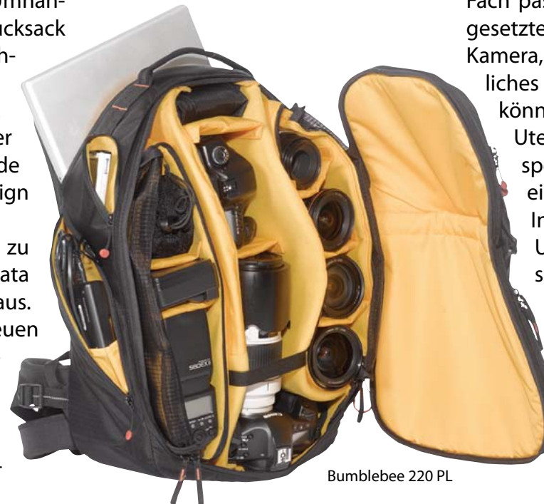
Bumblebee 220 PL

dergrund: Leichtigkeit und Schutz. Innovative Technologien und Materialien sorgen entsprechend für die besonderen Eigenschaften der neuen Taschenmodelle. Die schaumumhüllte Stahlfeder „Spine Guard“ dient als „Rückgrat“. Das RipStop Gewebe, aus dem die Taschen gefertigt sind, wird auch bei Fallschirmen verwendet und ist leicht, äußerst stabil sowie reißfest. An allen stoßanfälligen und -empfindlichen Stellen sorgt eine spezielle „Thermo Shield Technology“ für maximale Sicherheit. Ein sogenanntes „Aluminium Skeleton“