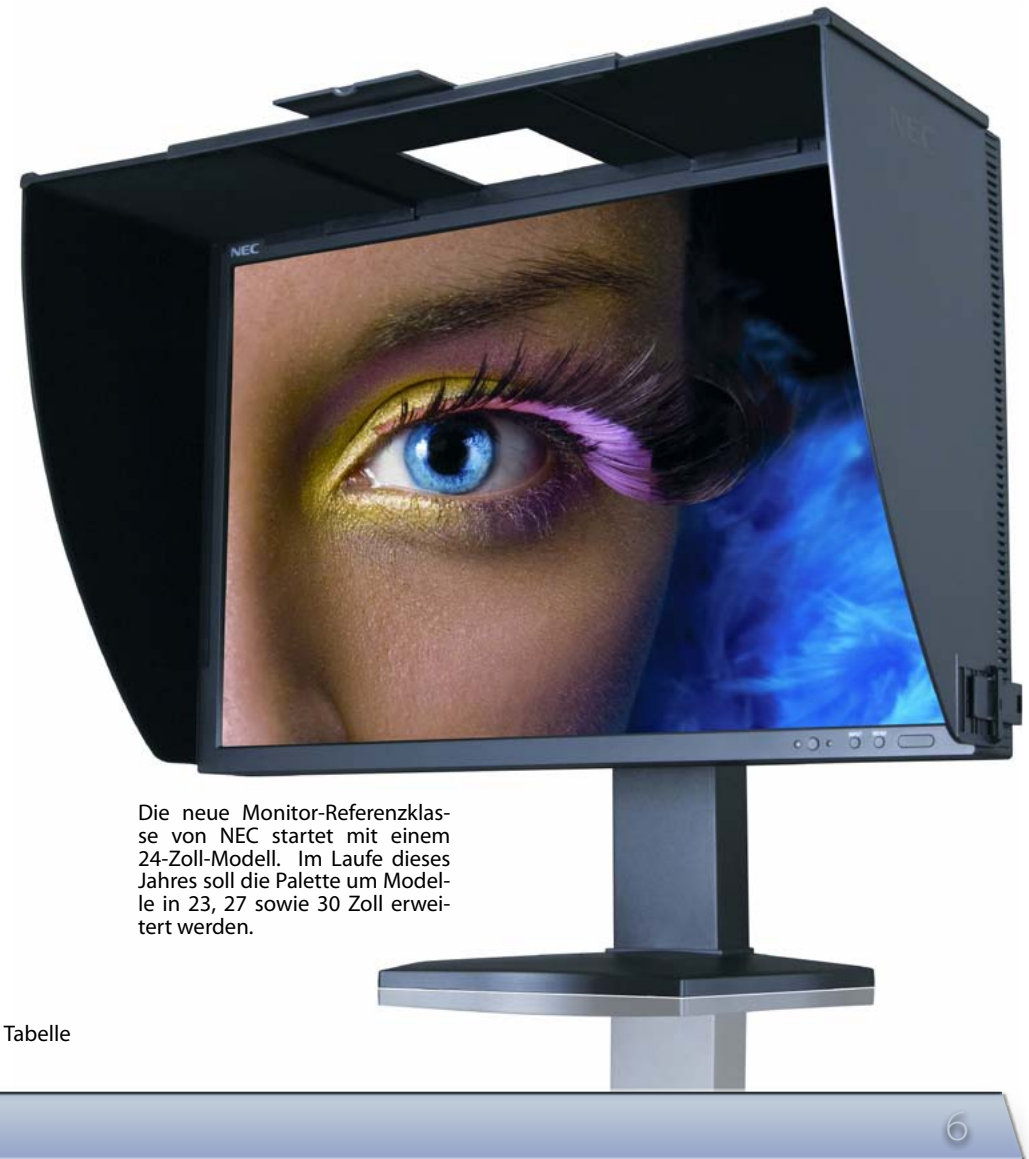
Die neue Monitor-Referenzklasse von NEC startet mit einem 24-Zoll-Modell. Im Laufe dieses Jahres soll die Palette um Modelle in 23, 27 sowie 30 Zoll erweitert werden.

mische Eigenschaften wie die Höhenverstellbarkeit um bis zu 150 mm oder die wahlweise Bildbetrachtung im Portrait- oder Landscape-Modus, die eine optimale Einrichtung des Bildschirms am Arbeitsplatz ermöglichen.