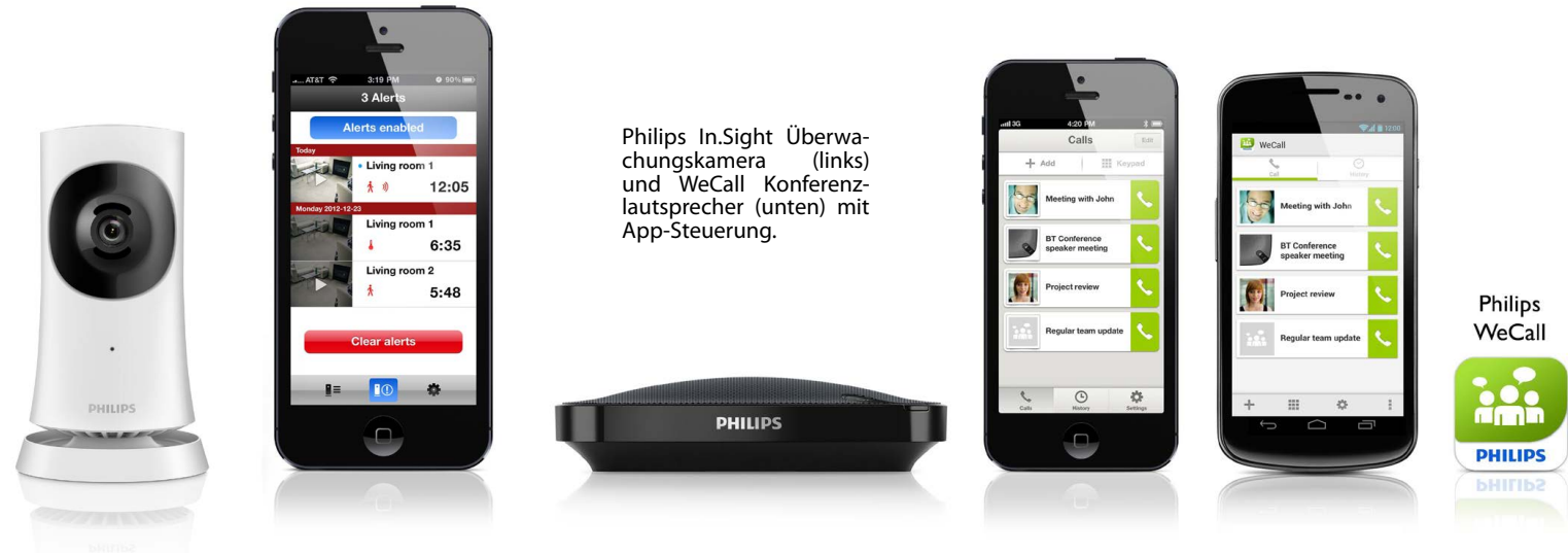
Philips In.Sight Überwachungskamera (links) und WeCall Konferenzlautsprecher (unten) mit App-Steuerung.

basierte Gerät fängt die Stimmen optimal ein und sorgt dank HD-Audiotechnologie mit Geräuschreduzierung und Echounterdrückung für eine hohe Klangqualität bei Telefongesprächen im Freisprechmodus. Vier um den Lautsprecher positionierte, omnidirektionale Mikrofone fangen das gesprochene Wort aus bis zu 5 m ein, egal in welchem Winkel der Sprecher zum Mikrofon steht. Dank Bluetooth und USB-Anschluss ist auch die Verbindung mit dem Smartphone, Tablet-PC oder Laptop schnell und einfach. Für zusätzlichen Komfort speichert die zugehörige WeCall-App Telefonnummern und Einwahldaten sowie Termine für Telefonkonferenzen. Der AECS7000 hat eine Akkulaufzeit von bis zu acht Stunden.