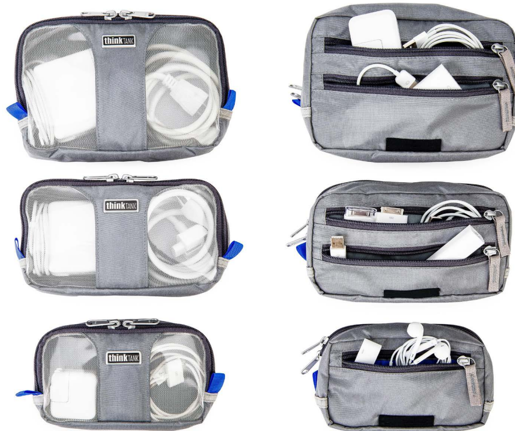
Von oben: PowerHouse Pro, Air, Tablet, jeweils Vorder- und Rückseite.

Schön auch, dass Think Tank statt kryptischen Modellbezeichnungen für die Taschen Namen gewählt hat, die man sich gut merken und über die man schmunzeln kann. Hier die beiden Modellserien im Überblick: